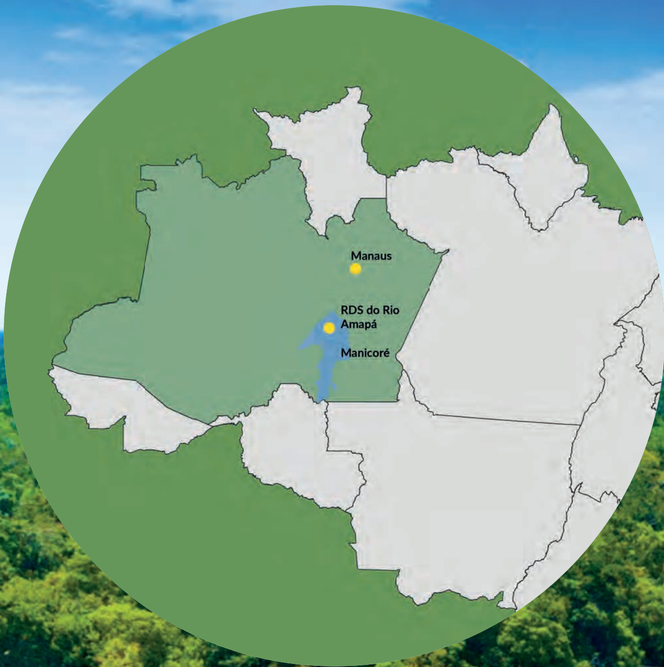
Localização da Reserva de Desenvolvimento Sustentável (RDS) do Rio Amapá no estado do Amazonas